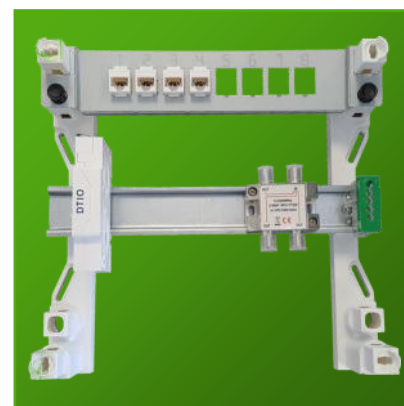
▶ Avec ou sans DTI RJ45