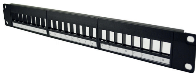
Panneau de brassage non équipé 24 ports 1u stp