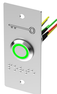
Bouton à plaque étroite