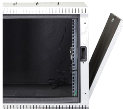
Panneaux amovibles avec clé